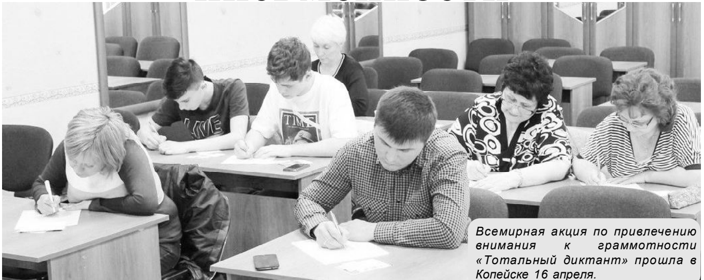
Всемирная акция по привлечению внимания к грамотности «Тотальный диктант» прошла в Копейске 16 апреля.